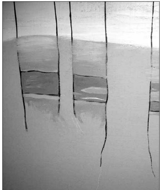
Une esquisse préliminaire permet aux élèves d'ajouter des détails importants dans une surface prédéfinie.

Conseils : Pour la couche de fond, vous pouvez utiliser différentes couleurs sur différentes parties de la murale selon les couleurs prévues pour le